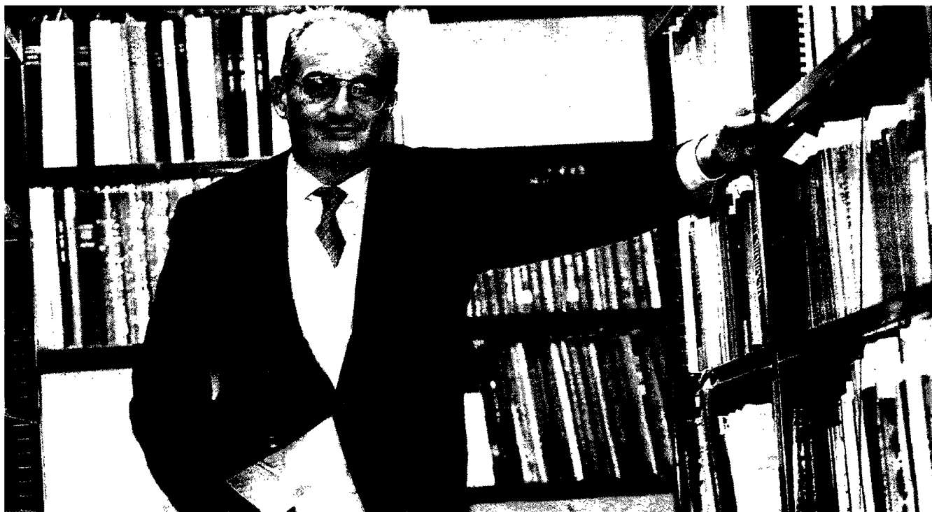
RETORE Enrico Decleva ha insegnato Storia. Dal 1986 al 1997 è preside della facoltà di Lettere; dal 2001 è rettore dell'Università di Milano